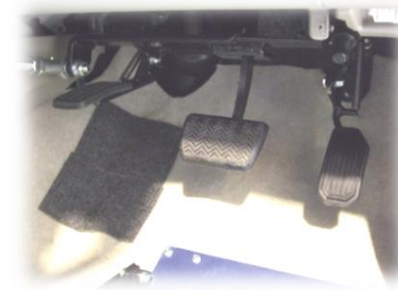
跳ね上げ式アクセルの例