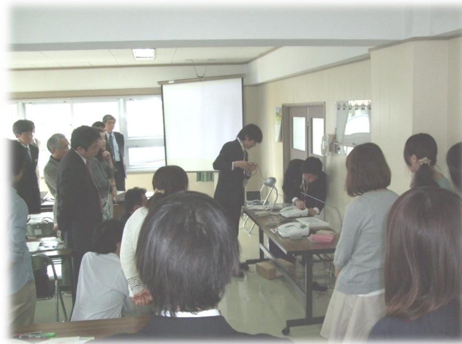
～コミュニケーション支援機器に関する 研修会を開催している様子～